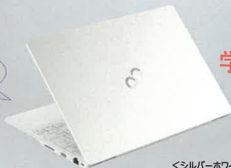
<シルバーホワイト>